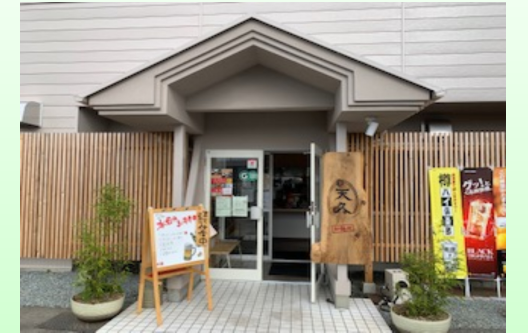
店内はコロナ対策がしっかりとされグリーン認定店です。