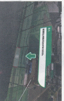
▲写真によるVR動画で現場を体験

この研修システムは、施工の管理に必要なスキルを学ぶためのもの。現場で撮影した画像を元に作成した動画で、業務の流れの解説を見たり、現場の安全対策の不備を探したりといったことを行う。具体的には、建築計画の基本スキルや仮設計画の知識、安全管理の知識、建築施工の知識などを学ぶためのコンテンツが開発されている。これまで実際の現場で行っていた集団